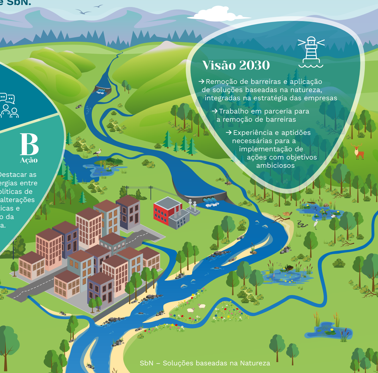
SbN – Soluções baseadas na Natureza